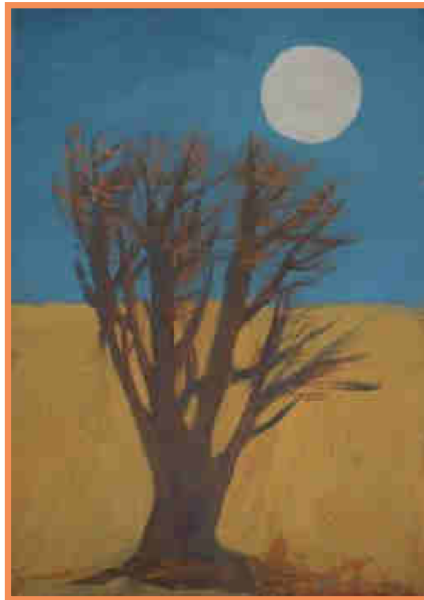
Albero e astro - tempera e olio su carta di Paolo Manaresi - Raccolta Lercaro

Passeggiate, escursioni, laboratori, workshop, incontri, letture, spettacoli e piantagioni di alberi